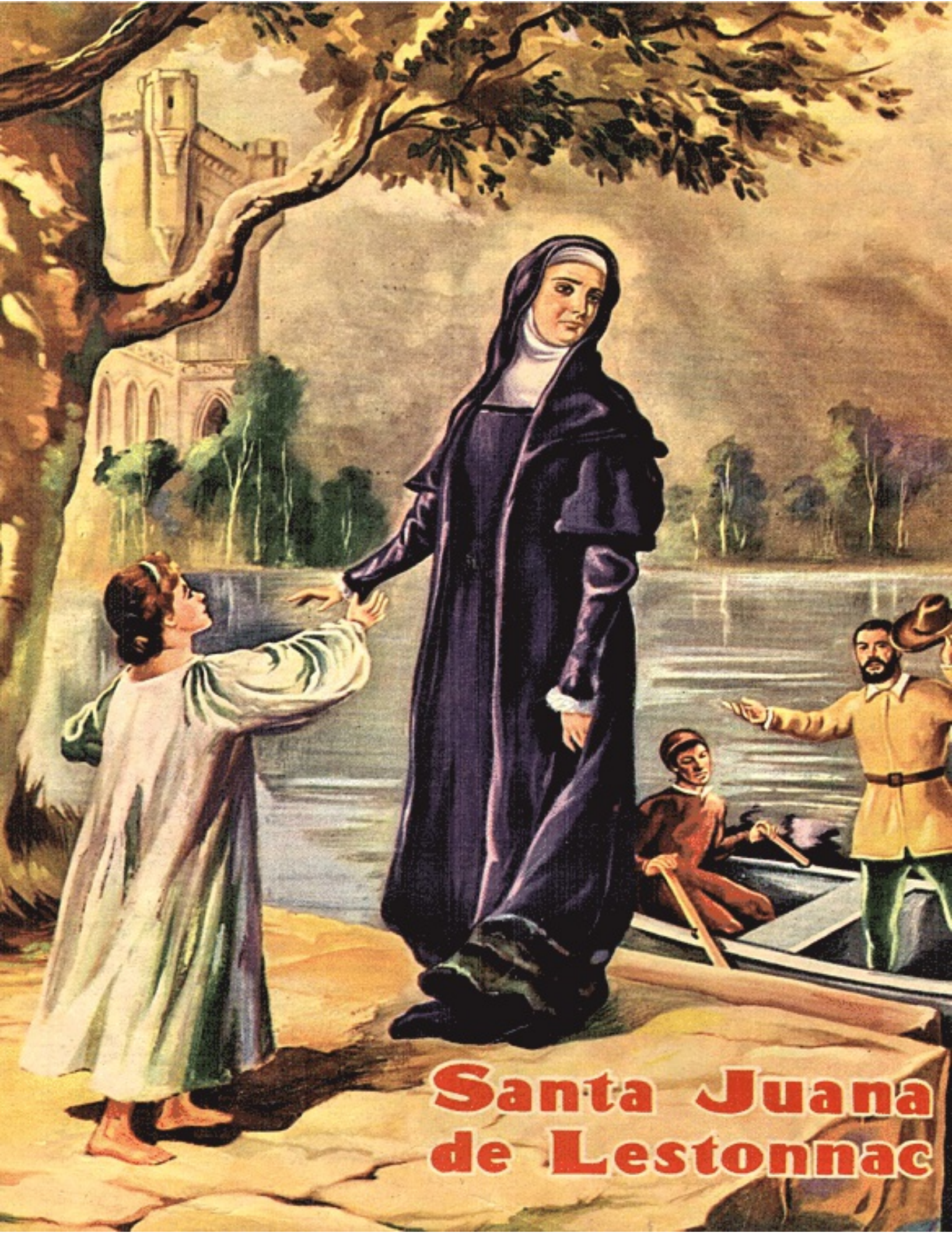
Santa Juana de Lestonnac