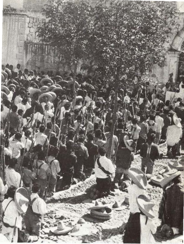
Misa en Huejuquilla el Alto en el atrio de la parroquia.