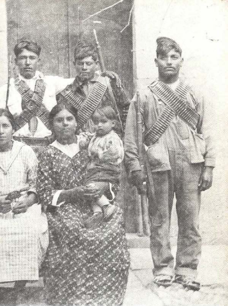
El último soldado del Regimiento Libres de Huejuquilla con su familia.