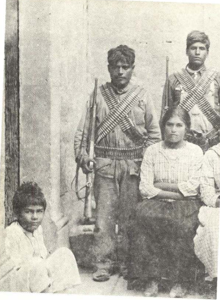
Soldados del regimiento Valparaíso con sus familiares.