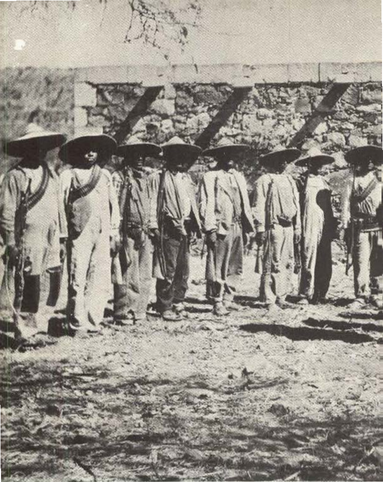
Un pelotón del primer escuadrón del Regimiento Valparaíso (Zac.).