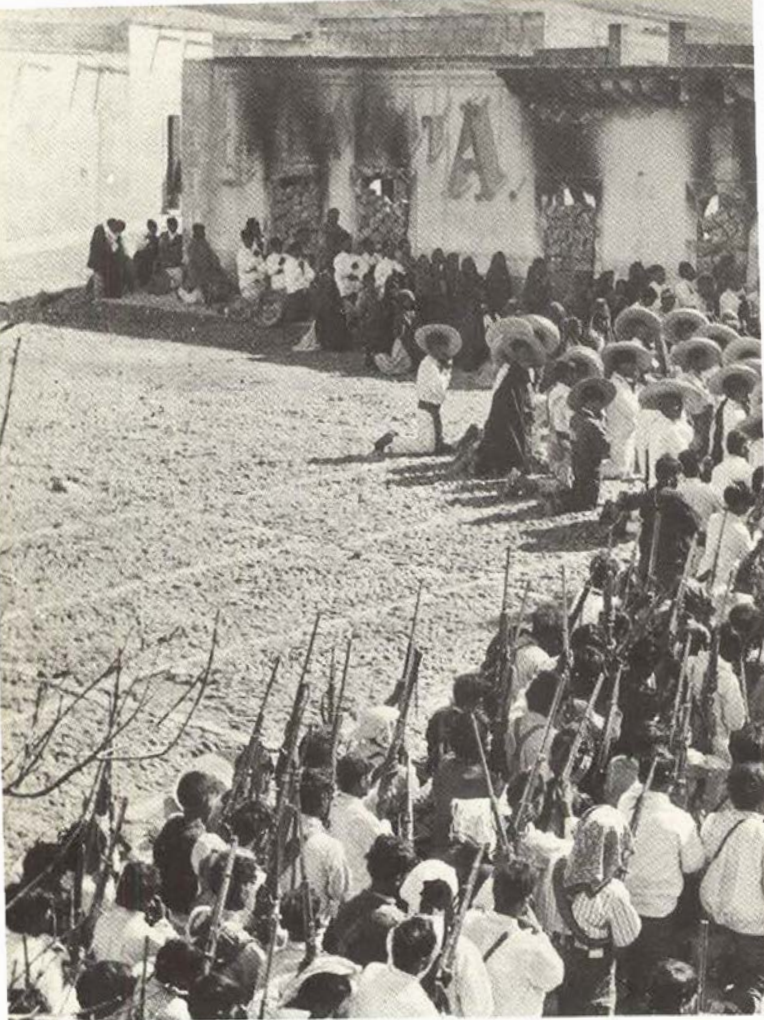
Comunión general el 1º de marzo de 1929 en Huejuquilla el Alto (Jal.).